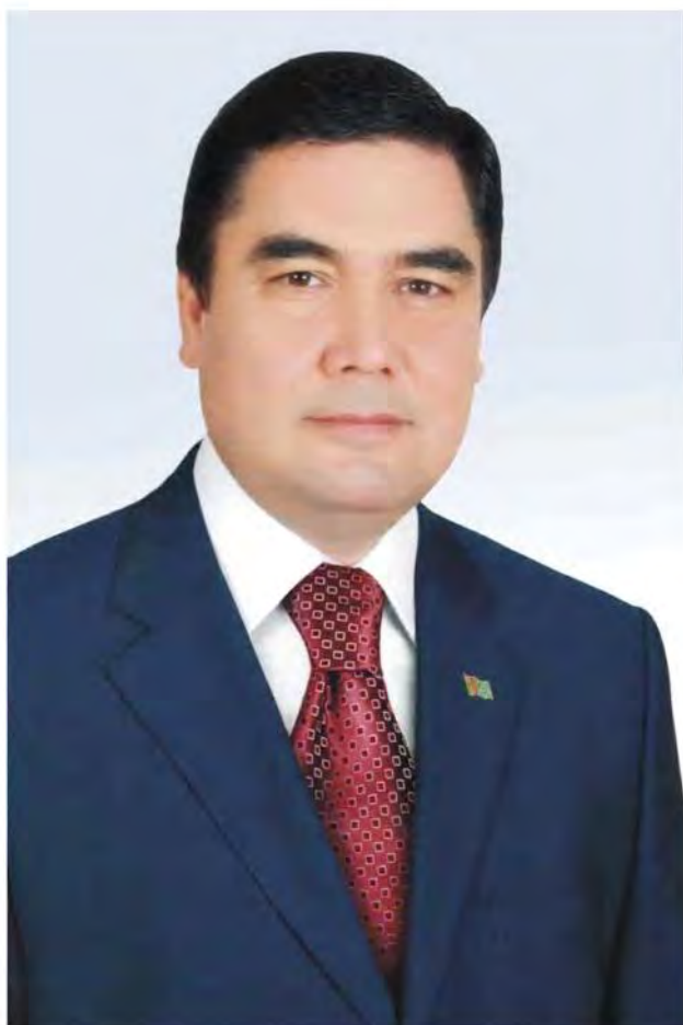
TÜRKMENISTANYŇ PREZIDENTI GURBANGULY BERDIMUHAMEDOW