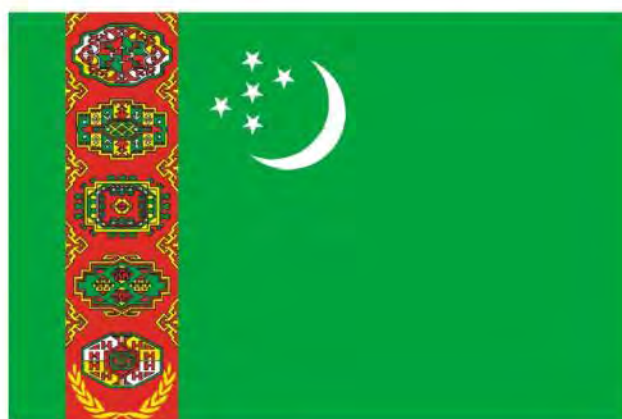
TÜRKMENISTANYŇ DÖWLET BAÝDAGY