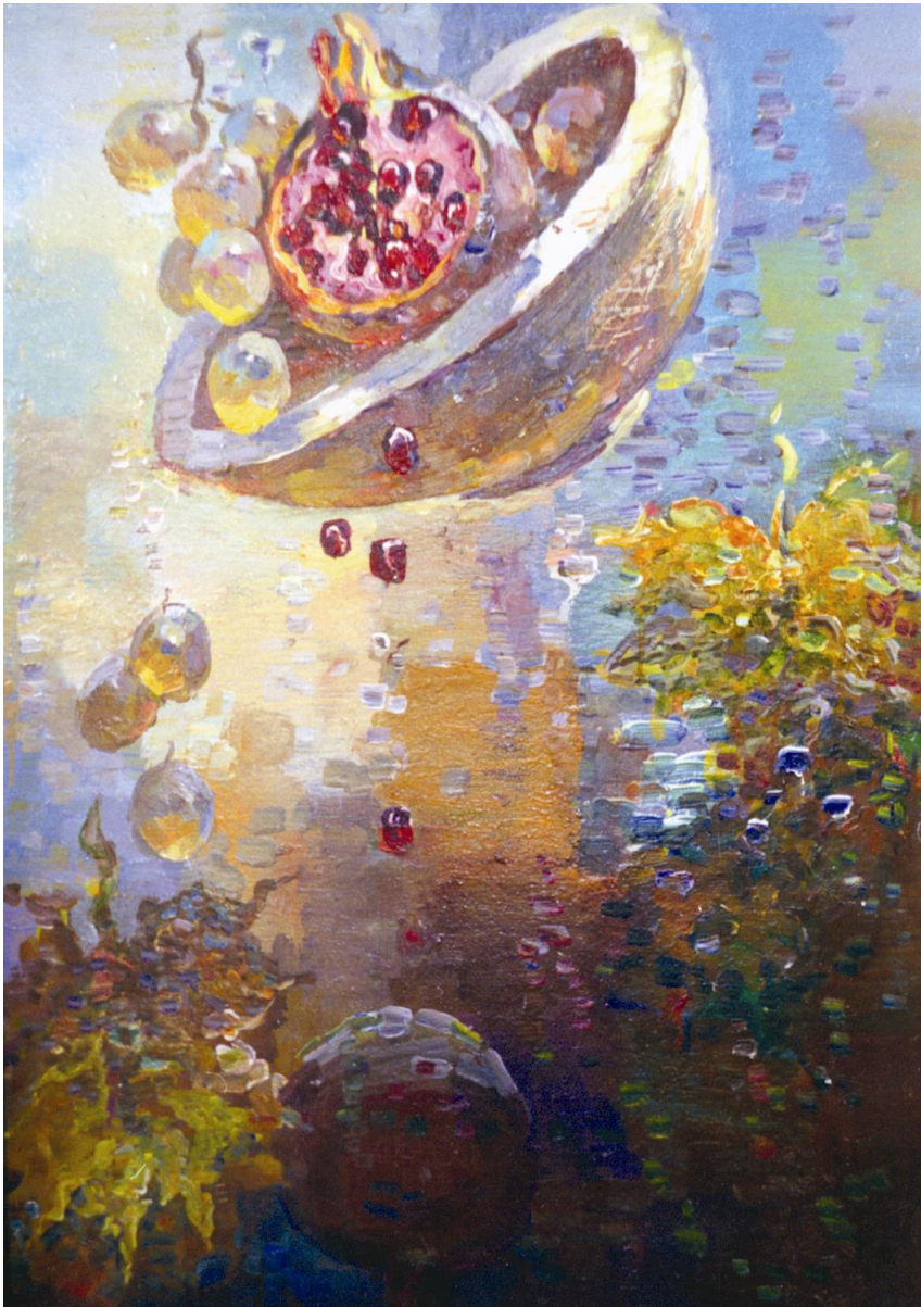
Çary Amangeldiýewyň çeken natýurmorty.