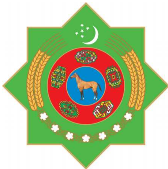
TÜRKMENISTANYŇ DÖWLET TUGRASY