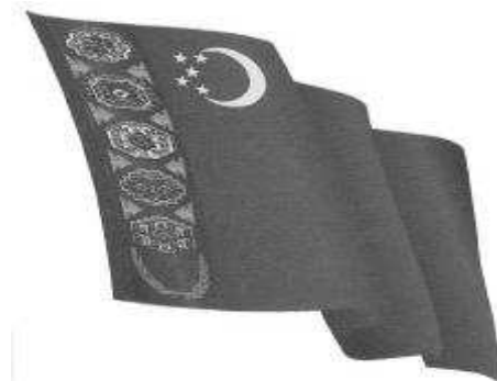
TÜRKMENISTANYŇ DÖWLET BAÝDAGY