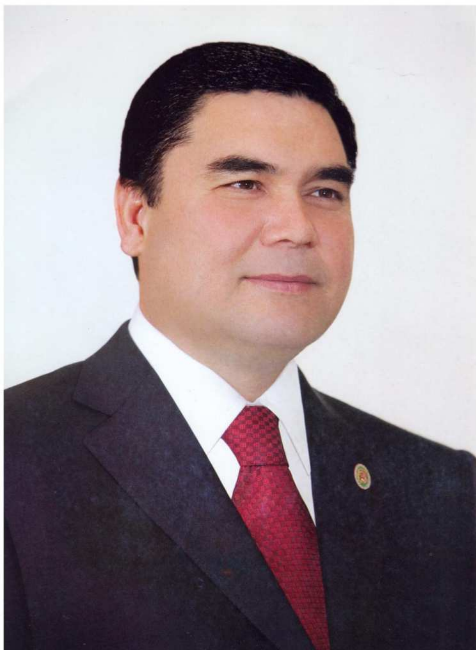
GARAŞSYZ, BAKY BITARAP TÜRKMENISTANYŇ HORMATLY PREZIDENTI GURBANGULY MÄLIKGULYÝEWIÇ BERDIMUHAMEDOW