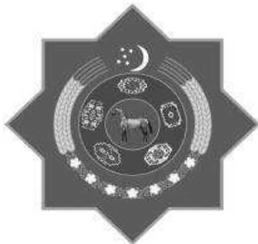
TÜRKMENISTANYŇ DÖWLET TUGRASY