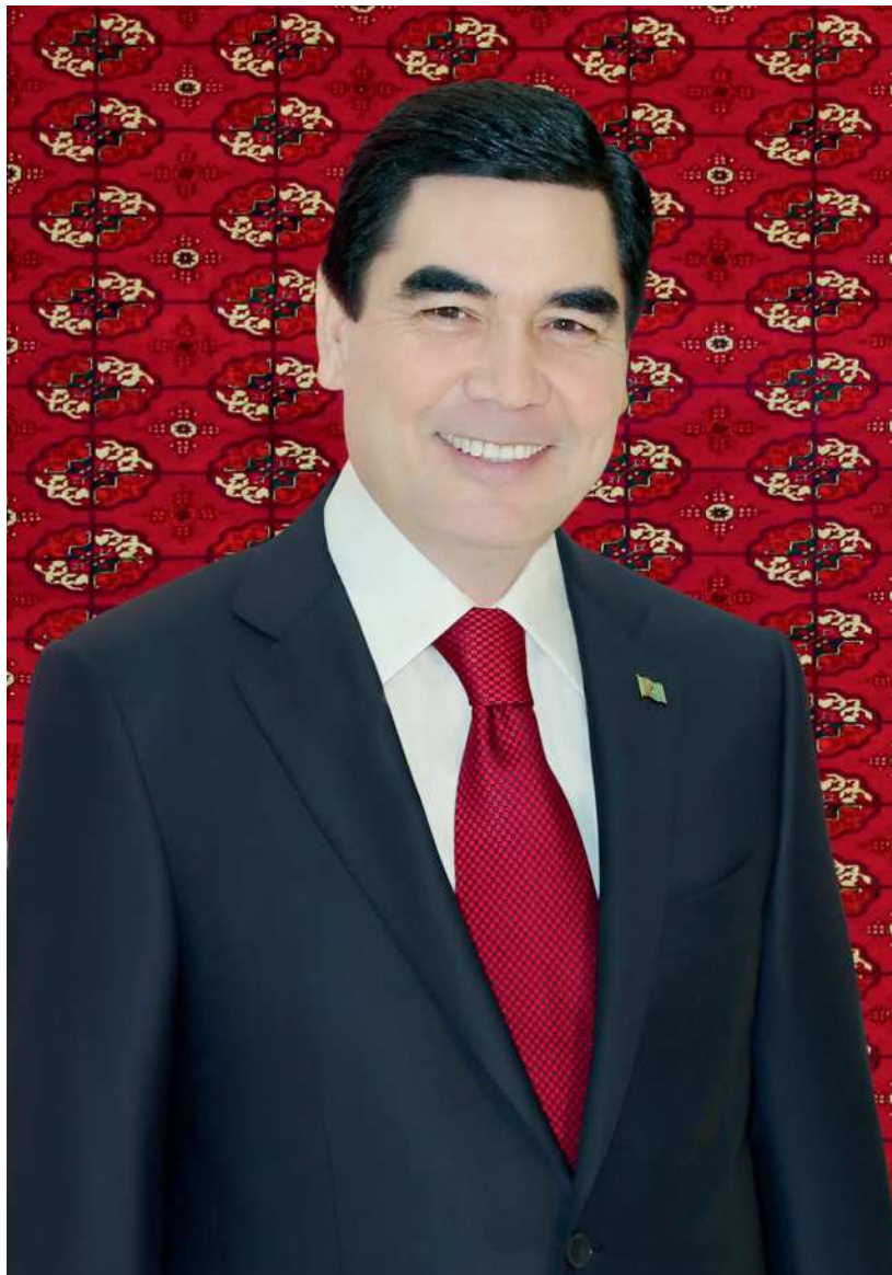
TURKMENISTANYN PREZIDENTI GURBANGULY BERDIMUHAMEDOW