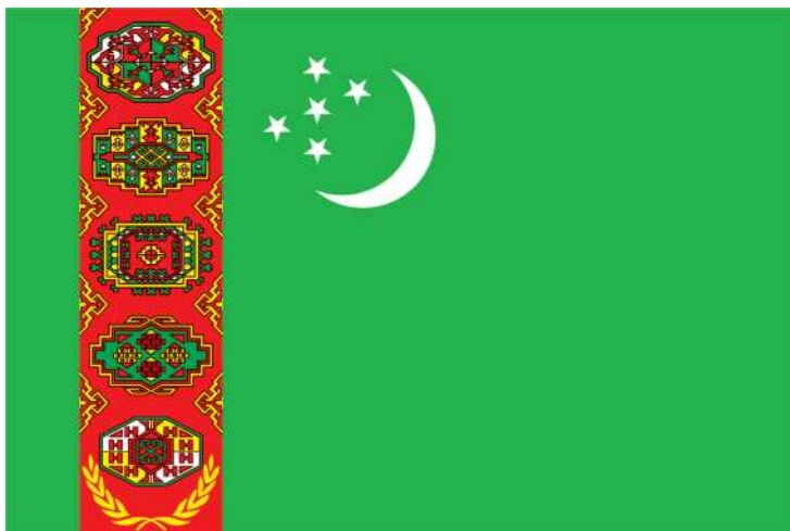
TURKMENISTANYN DOWLET BAYDAGY